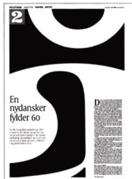
Politiken vandt guld med en sektionforside i anledning af, at bogstavet "å" fyldte 60 år.

5. november hædrede Dansk Design Center det bedste danske design med Den Danske Designpris, som blev overrakt af kronprins Frederik.