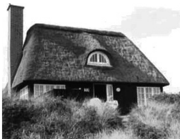
"Skorstenen" i Søndervig

Læs mere og tilmeld dig på www.journalistforbundet.dk – klik på Freelanceforum '08