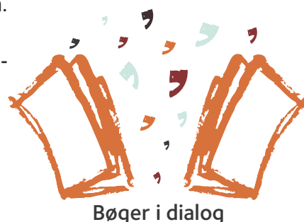
Bøger i dialog