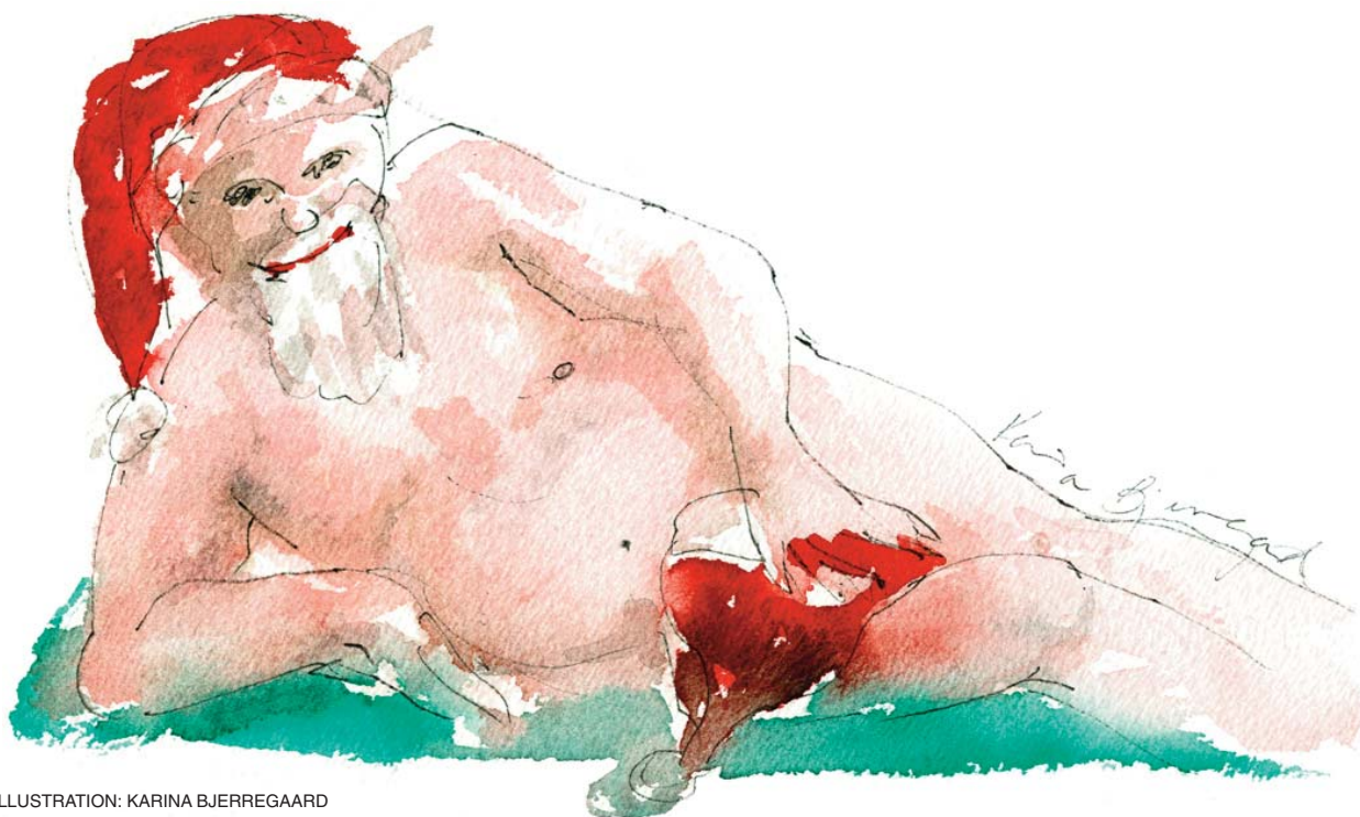
ILLUSTRATION: KARINA BJERREGAARD