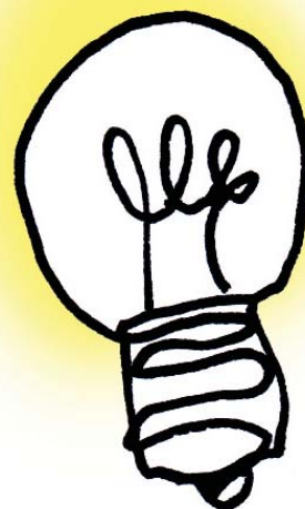
ILLUSTRATION: ULRIKE VON ROSEN