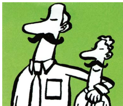
ILLUSTRATION: NIELS BO BOESEN

Har du spørgsmål vedrørende aftalen mellem DJ og Fitnessdk, så skriv til sbs@journalistforbundet.dk