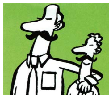
ILLUSTRATION: NIELS BO BOJESSEN

Har du spørgsmål vedrørende aftalen mellem DJ og Fitnessdk, så skriv til sbs@journalistforbundet.dk