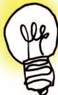
ILLUSTRATION: ULRIKE VON ROSEN